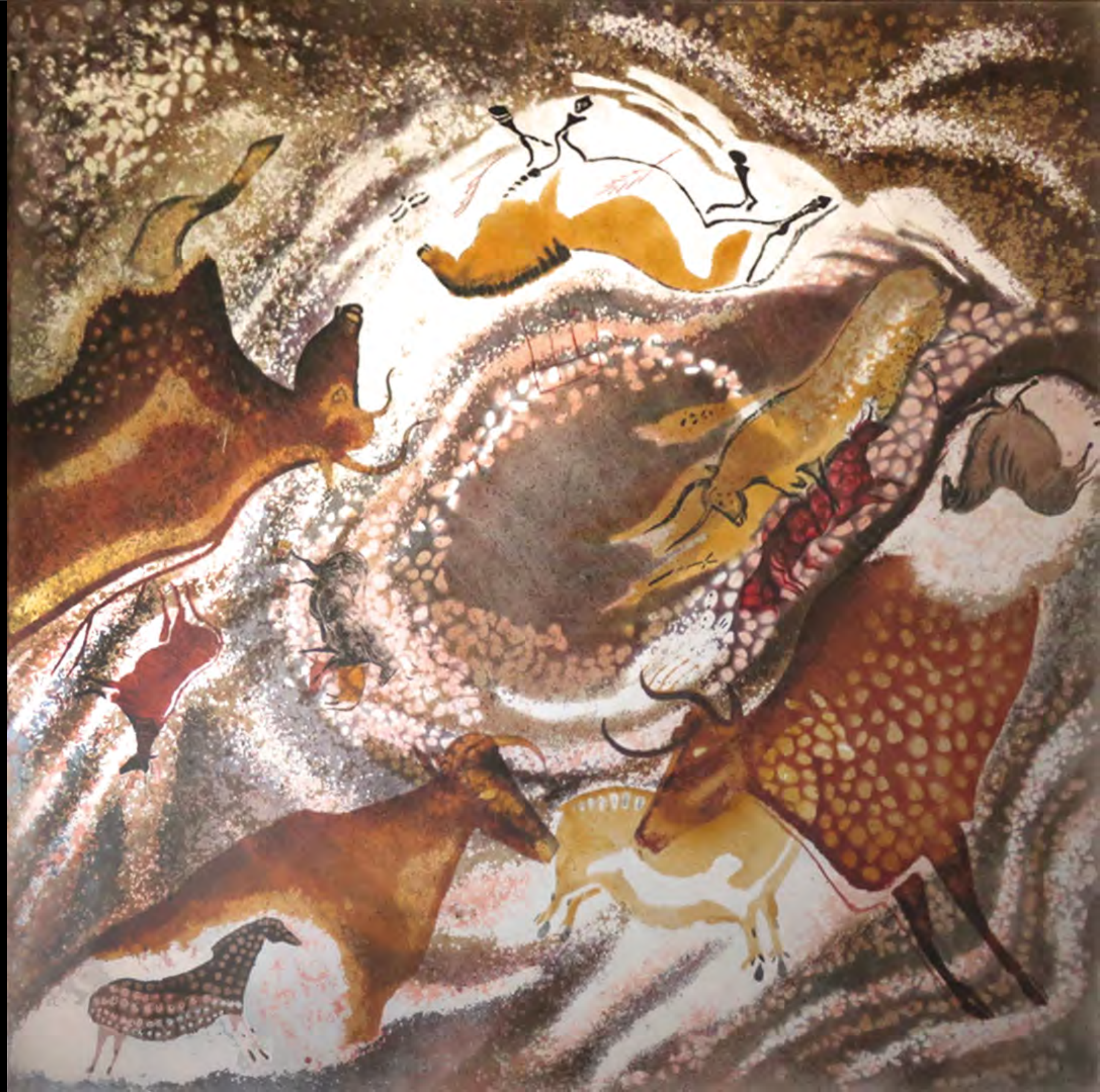
Lanterne des aurochs, vue de dessus.